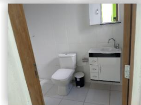
Estúdio de gravação com banheiro e cozinha